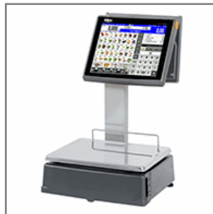
D-955 Doble Cuerpo