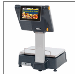
D-955 Doble Cuerpo (Lado Comprador con display TFT de 7'')